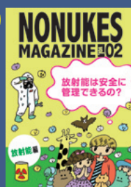
No Nukes Magazine Vol.2 放射能編